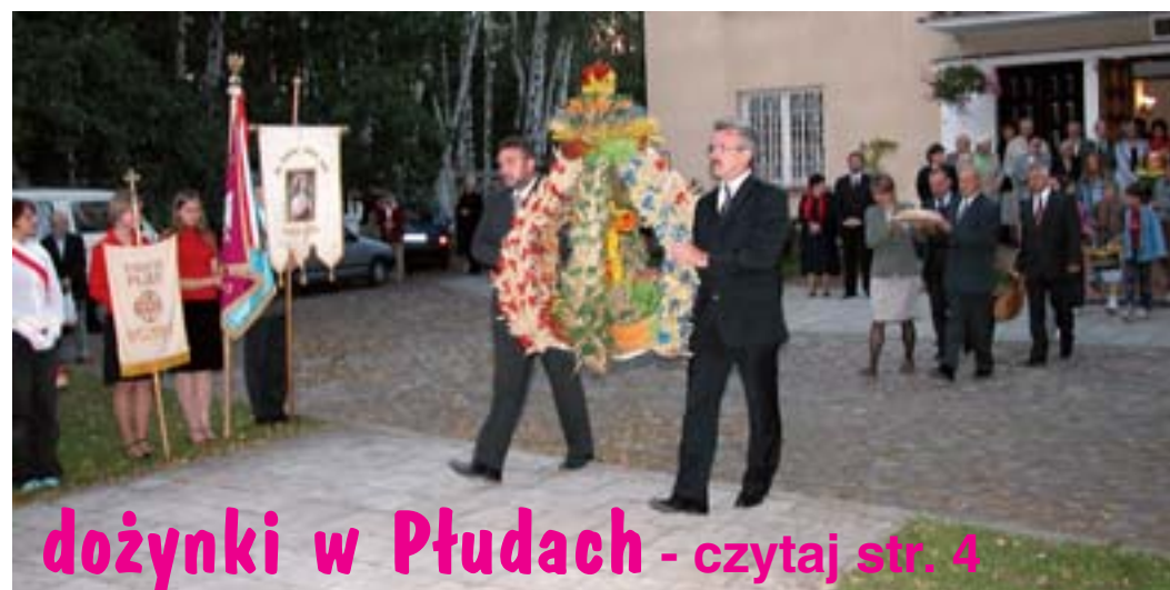
dożynki w Płudach - czytaj str. 4