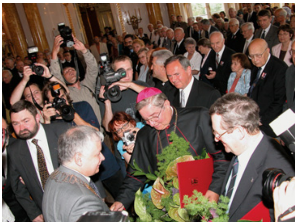
XXXV Sesja Pragi Północ